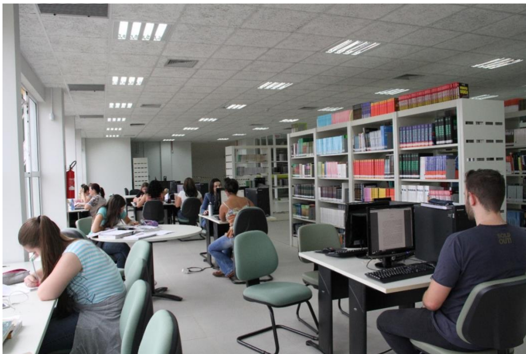
Figura 1 – Biblioteca UFFS Campus Chapecó

As figuras devem ser apresentadas conforme exemplo da